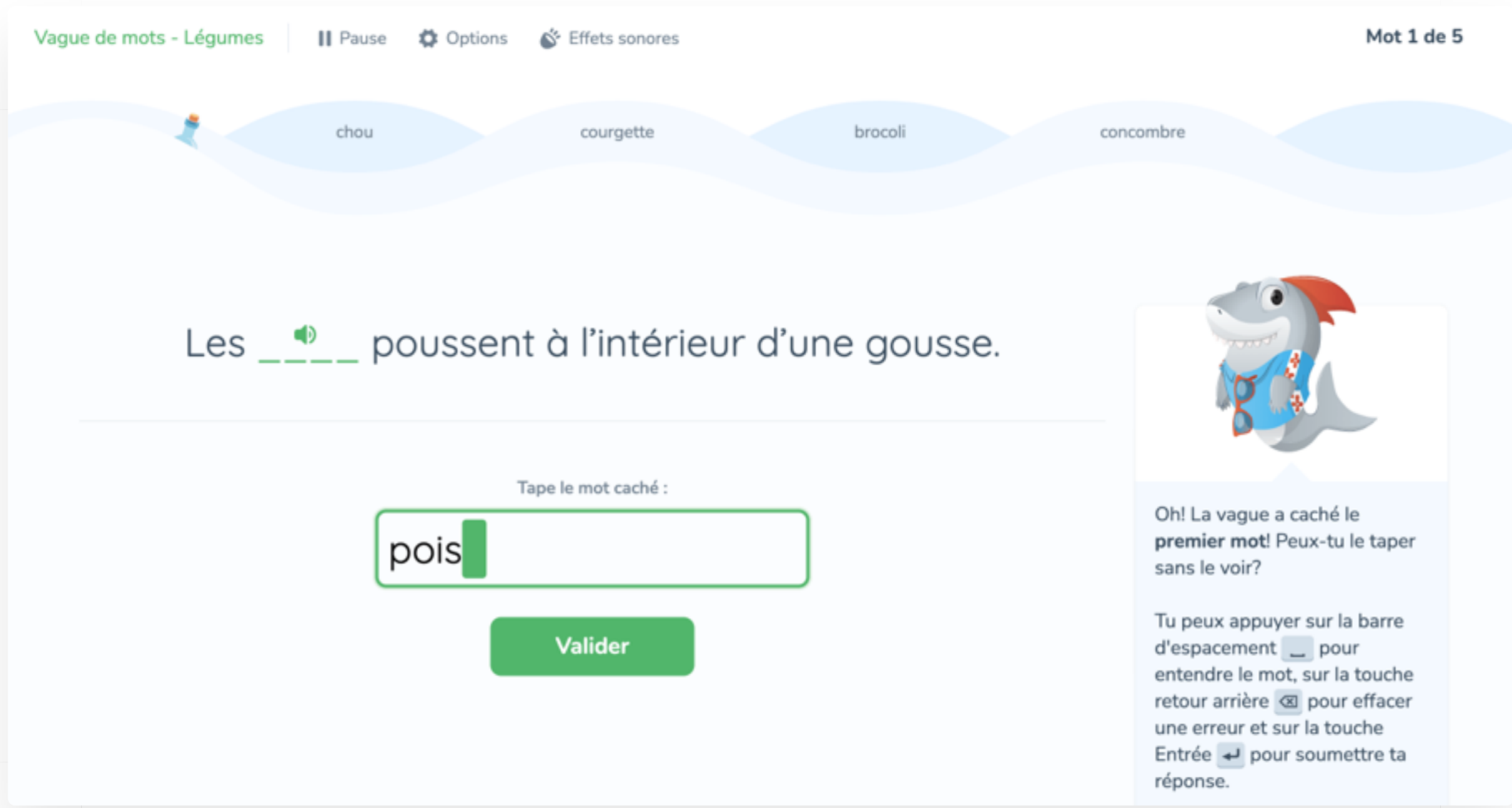
Le mot à taper est ensuite caché et dicté.

Une fois que les élèves ont bien intégré les réflexes de frappe pour un mot, il se retrouve caché dans le contexte d'une phrase complète. Une voix dicte la phrase et les élèves doivent taper le mot dans l'espace prévu. Est-ce que vos élèves se souviendront de la bonne orthographe? Voilà un défi supplémentaire qui les incitera à se concentrer!